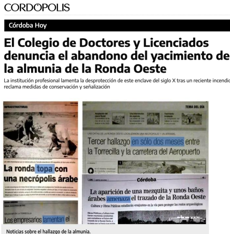
Figura 1. Artículo de prensa sobre la denuncia del abandono del yacimiento de la Almunia de la Ronda Oeste

Noticias sobre el hallazgo de la almunia.