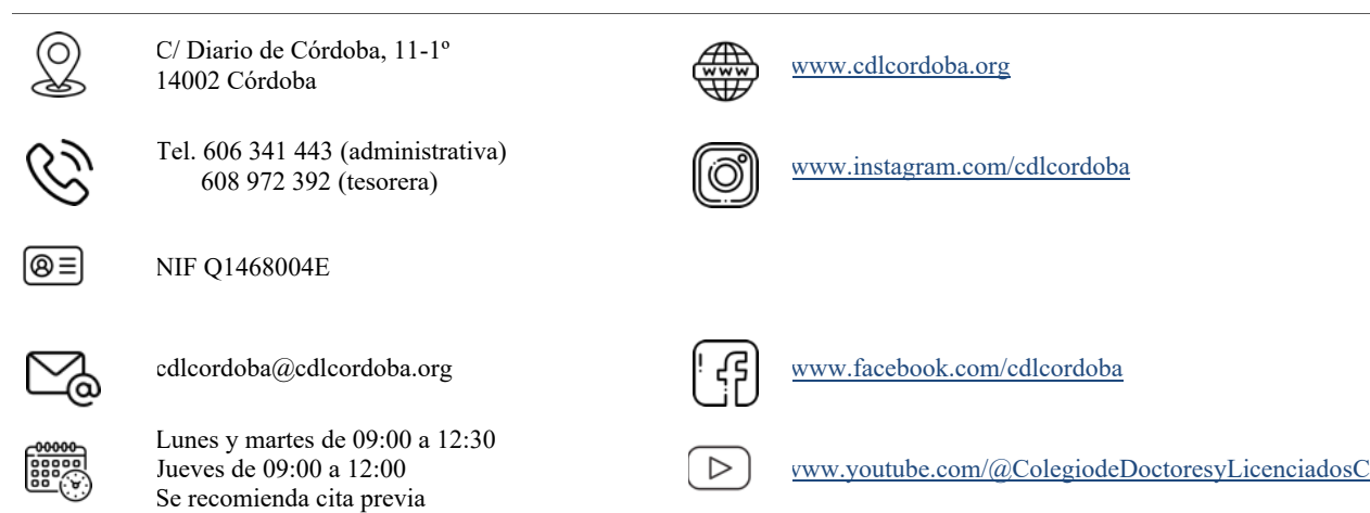
Tabla 1. Información institucional

Respecto a otra información institucional, en la Tabla 1 se recoge lo relativo a ubicación de la sede colegial, datos de contacto, CIF, horarios de atención, presencia en redes sociales, etc.